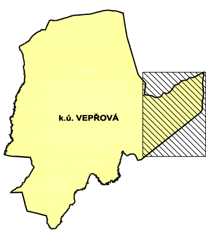
VYZNAČENÍ VÝŘEZU VE VZTAHU K ŘEŠENÉMU ÚZEMÍ